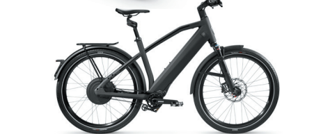
Sport, Suspension Fork & Suspension Seatpost Kinect